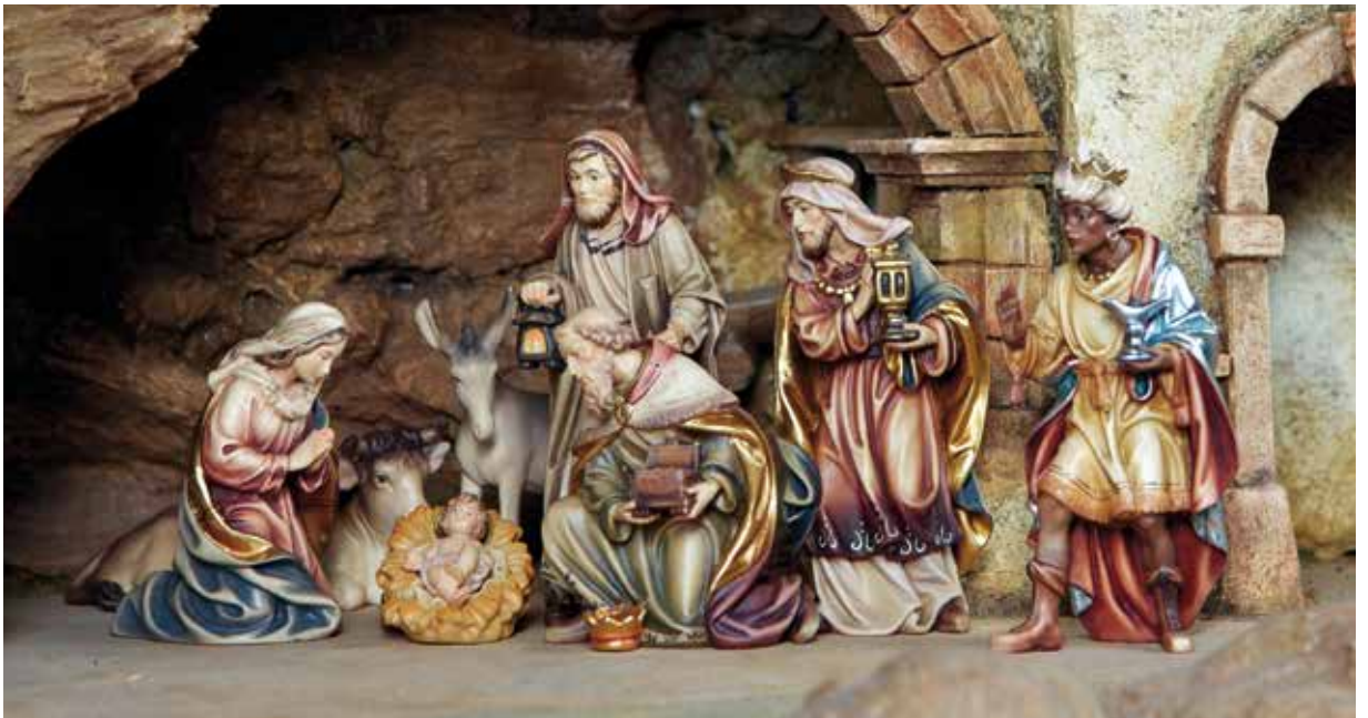
Die Anbetung der Könige / L'Adorazione dei Magi / The Adoration of the Magi