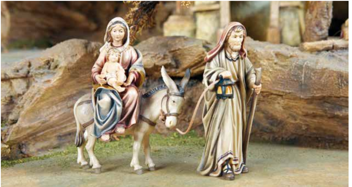
Die Flucht nach Ägypten / La fuga in Egitto / The Flight to Egypt