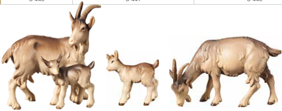
Art. Nr. 0 449 0 450 0 451