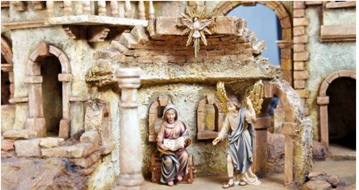
Die Verkündigung an die Maria / Scena dell'Annunciazione a Maria / The Annunciation to Mary