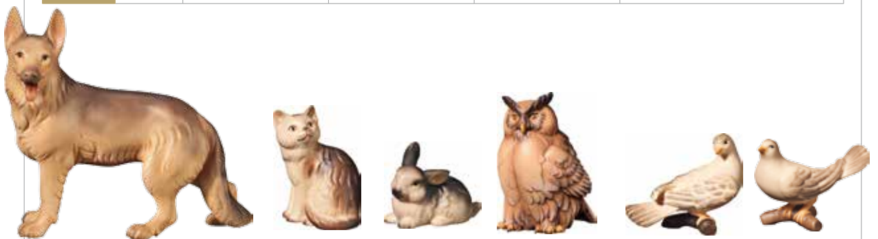
Art. Nr. 0 571 0 575 0 578 0 579 0 581 0 580