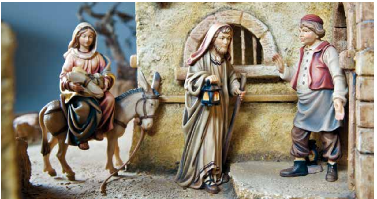
Die Herbergsuche / La ricerca d'alloggio / No Room at the Inn